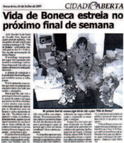
Vida de Boneca