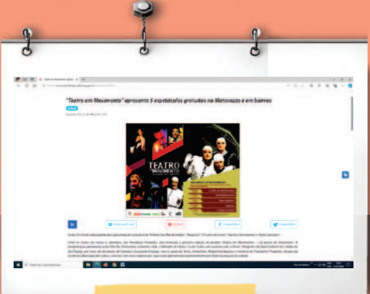
Teatro em Movimento