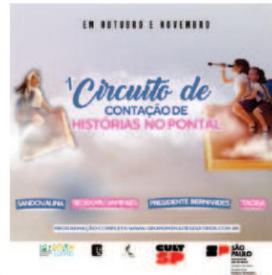
1º Circuito de contação de histórias no Pontal - ProAc 42-2022