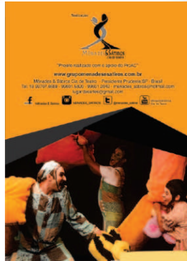
Circulação Inventa-Desinventa ProAc 08-2018