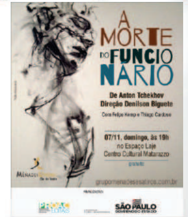
A Morte do Funcionário ProAc 01-2020