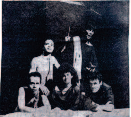
O elenco de "Abismo de Rosas", da Companhia Ciclo Teatro

festival teve início ontem e vai até o próximo dia 30, quando serão premiados os vencedores nas categorias melhor espetáculo, melhor direção, melhor ator, melhor atriz, melhor figurino, melhor cenografia, melhor somoplastia e melhor iluminação. Em novembro daquele mesmo ano recebeu indicações no Festival de Teatro de Curitiba, como para melhor ator, melhor atriz, melhor direção e melhor iluminação.