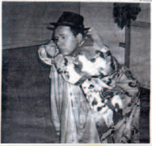
Contos e Reencontros

No fim de semana, a Cia Círculo Teatro, direção e concepção (cenografia, iluminação e sonoroplastia) - Denilson Bignato, figurinos e Adereços: Eduardo Costa. Participação de Zildere Silva (voz), execução cenográfica - Jair Ramos e figurinos - Lourdes Santos, iluminação/sonoroplastia - Chapeuzinho Vermelho a realização é da Olho Nu Promoções. Poderá ser vista nos dias 17 e 18 de março no Teatro Municipal com maiores informações 223-6289 ou 972-4070.