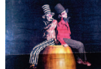
Dois Idiotas Sentados cada qual no Barril

Obras 'Dois idiotas sentados cada qual no seu barril' tem uma proposta cultural, ágil e divertida