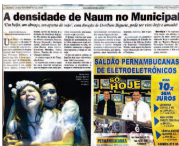
Um beijo, um abraço, um aperto de mão