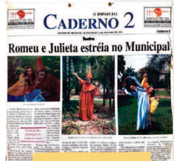
Romeu e Julieta