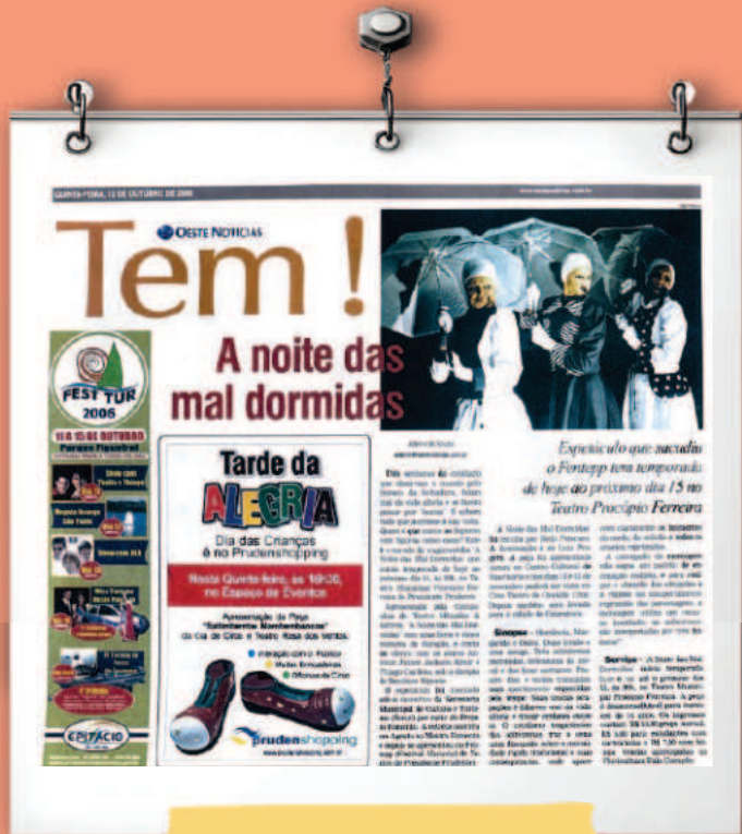
A Noite das Mal Dormidas