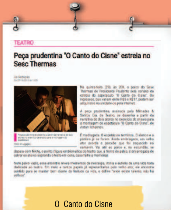
O Canto do Cisne