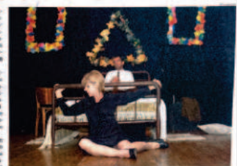
Fica Comigo Esta Noite