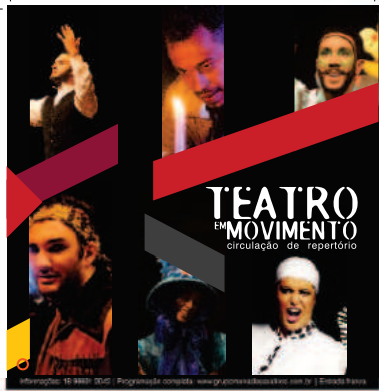
Teatro em movimento Circulação regional - ProAc ICMS