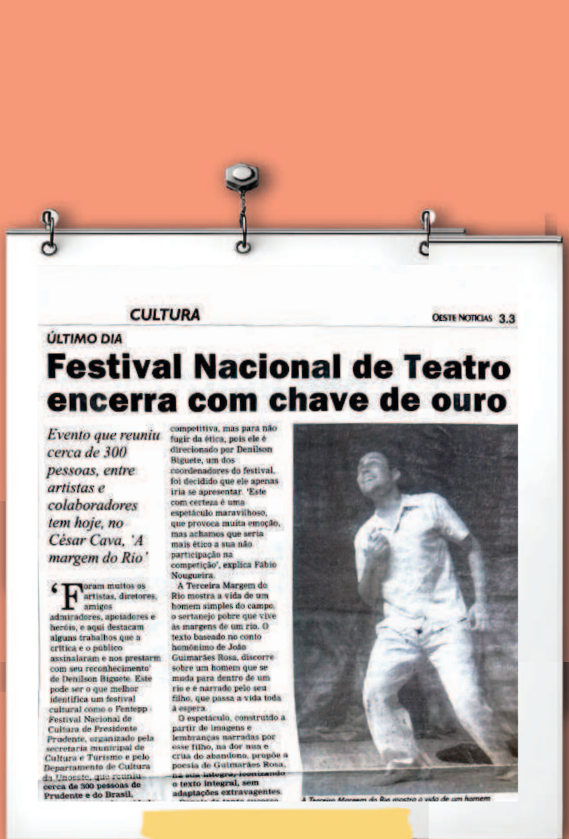
A Terceira Margem do Rio