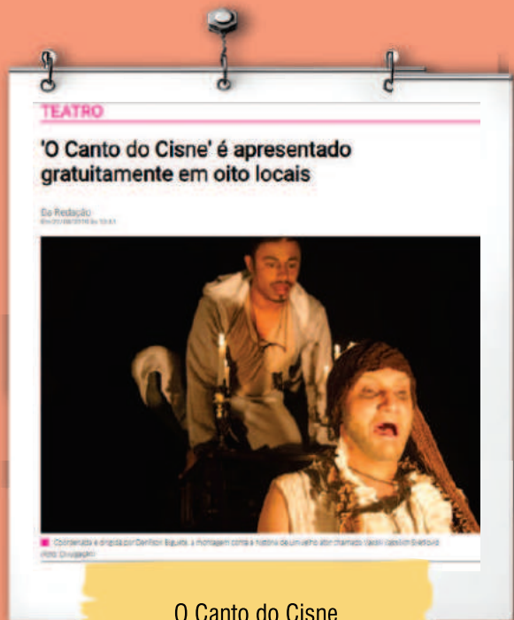
O Canto do Cisne