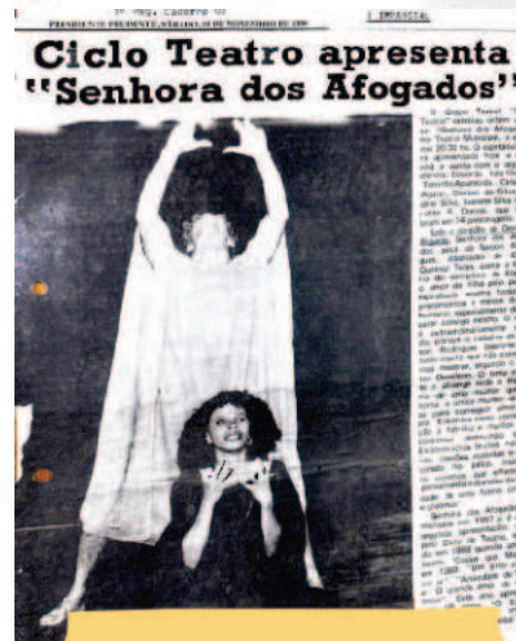
Senhora dos afogados